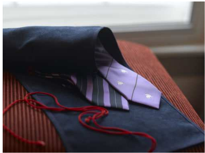
Cravates Atelier F&B