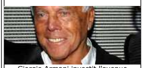
Giorgio Armani investit l'avenue Montaigne