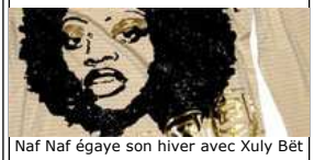
Naf Naf égaye son hiver avec Xuly Bét