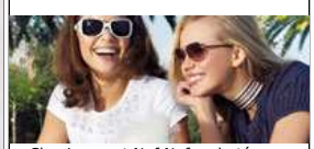
Chevignon et Naf Naf rachetés par Vivarte