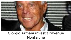
Giorgio Armani investit l'avenue Montaigne